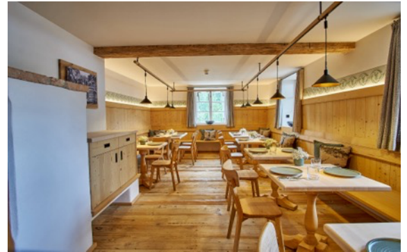
König Ludwig II Stube