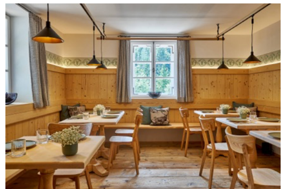
König Max I Stube

Tegernsee Card Wandern Berg- und Wintersport Eigene Kegelbahn Fahrradverleih Kutsch- und Pferdeschlittenfahrten